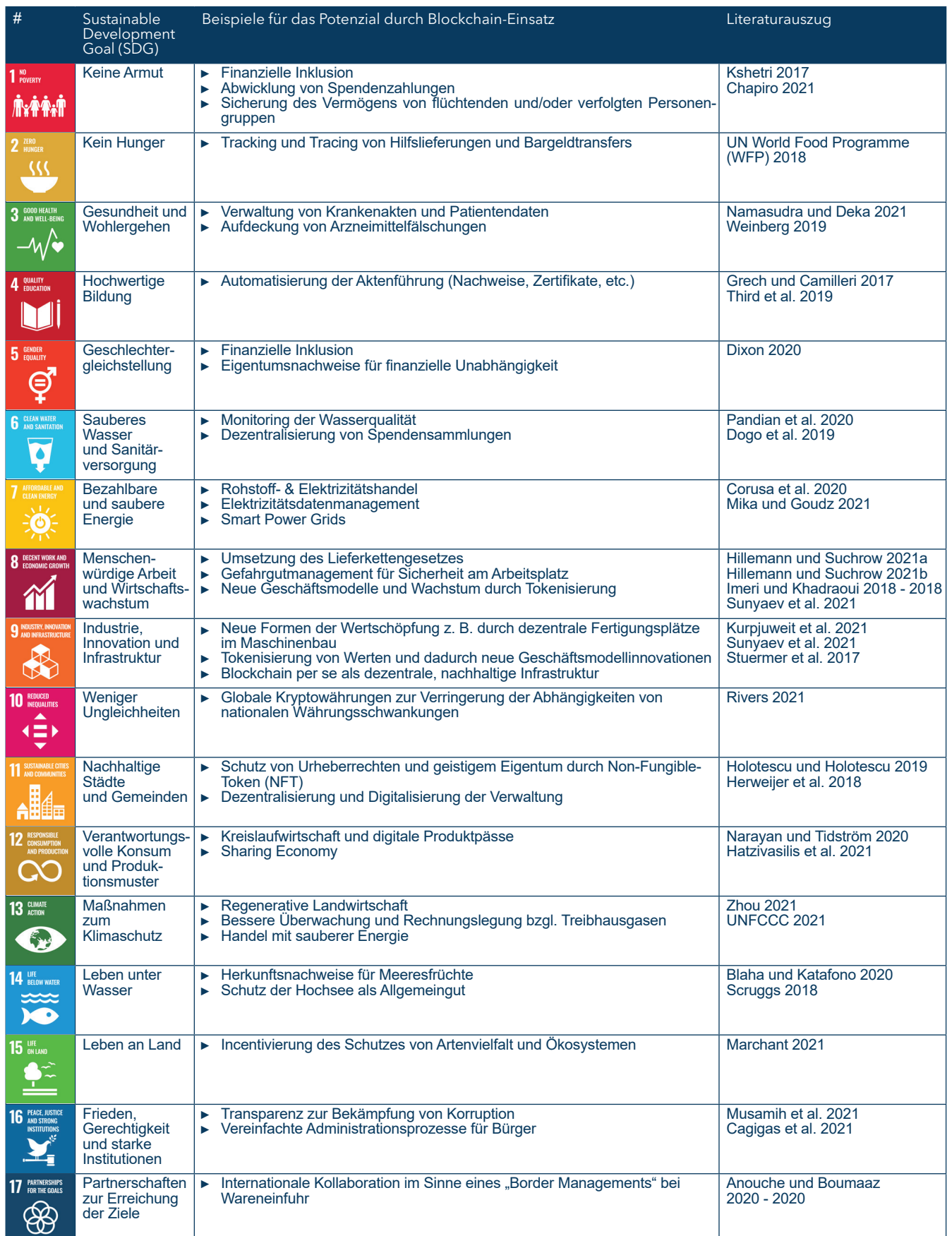
Tabelle 1 - Ausgewählte Potenziale eines Blockchain-Einsatzes zur Erreichung von Nachhaltigkeitszielen