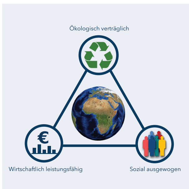
Abbildung 1 - Zieldreieck der Nachhaltigkeit (i. A. Pufé 2017)